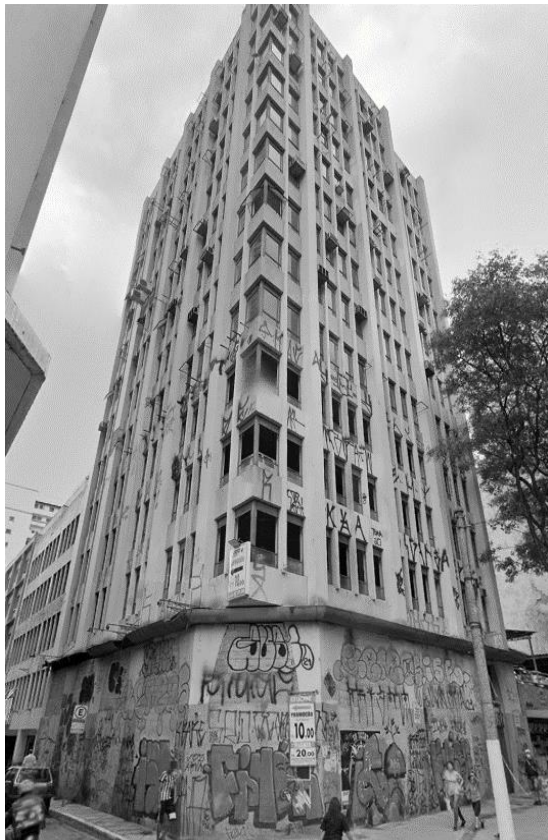
EDIFICIO TAQUARI Avenida Ipiranga, 952